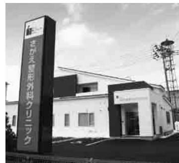
(インタビュー：長谷川)

A：脊椎や膝関節、股関節のMRIを多く依頼していますが、2～3日以内で予約が取れ、検査当日に結果説明が出来て非常に助かっています。今後ともこの検査システムを継続していただければ幸いです。また脊椎疾患や外傷患者の手術を快く引き受けて下さり感謝しています。今後術後のフォローの面でうまく連携がとれるよう、地域連携パスに参加できればよいと思います。