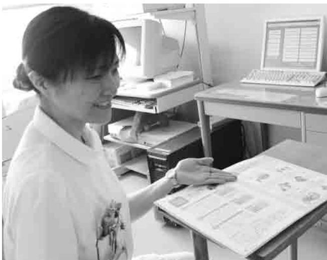
特定保健指導の様子

特定保健指導において大切なのは、私達保健指導する側が常に指導技術や新しい知識、情報を対象者に還元し、対象者が主体的に生活習慣の改善に取り組んでいく力を引き出すことです。そのためにこの資格は、5 年毎に新たに研修を受け更新が必要となります。当院にはこの資格を持つ保健師 3 名と、管理栄養士 1 名がいます。普段私達が関わるのは、入院している患者さんではなく生活習慣病になるリスクが高い人や、生活習慣病を持ちながら生活を送っている人達です。これからも健康維持や健康増進に貢献できるよう経験や知識の習得に励んでいきたいと思ひます。