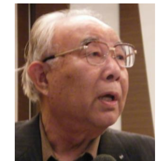
参加していただきました先生方より、たくさんの討論をいただきました。